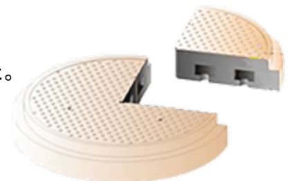
高純度アルミナ溶射静電チャック