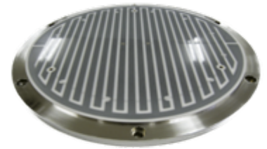
高純度アルミナ静電チャック