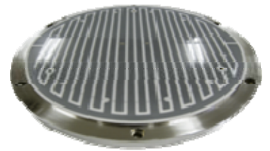
高純度アルミナ静電チャック