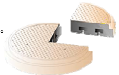
高純度アルミナ溶射静電チャック